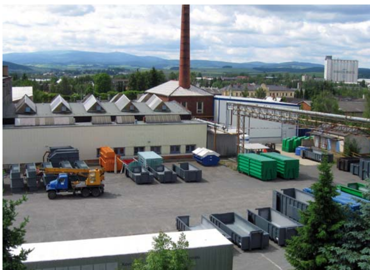
Produktionsräumlichkeiten in Bruntál

Durch Investitionen in die moderne Produktionstechnologie und durch Rationalisierung des Produktionsverfahrens wollen wir langfristig zur Sicherstellung des ökonomischen und sicheren Umgangs mit Abfällen beitragen.